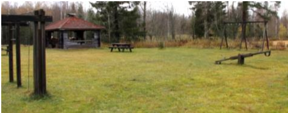
Kuva 4 Leikkikenttää ennen hanketta

Piha-alueelta kaadetut puut todettiin huonosti säilyviksi tasapainorataa varten, joten kyläläisiltä saatiin lahjoituksena kelopuuta, jolle tehtiin tervapetsikäsittely paremman lahosuojan saamiseksi.