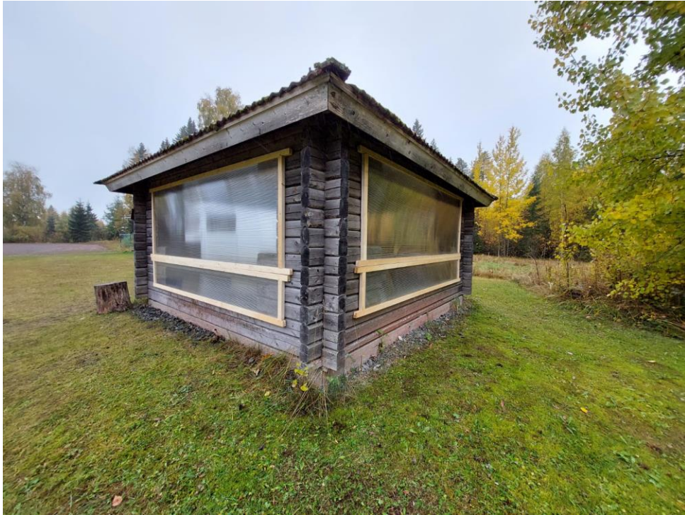
Kuva 77 Nyt grillikatoksessa on siirrettävät tuulisuojailevyt