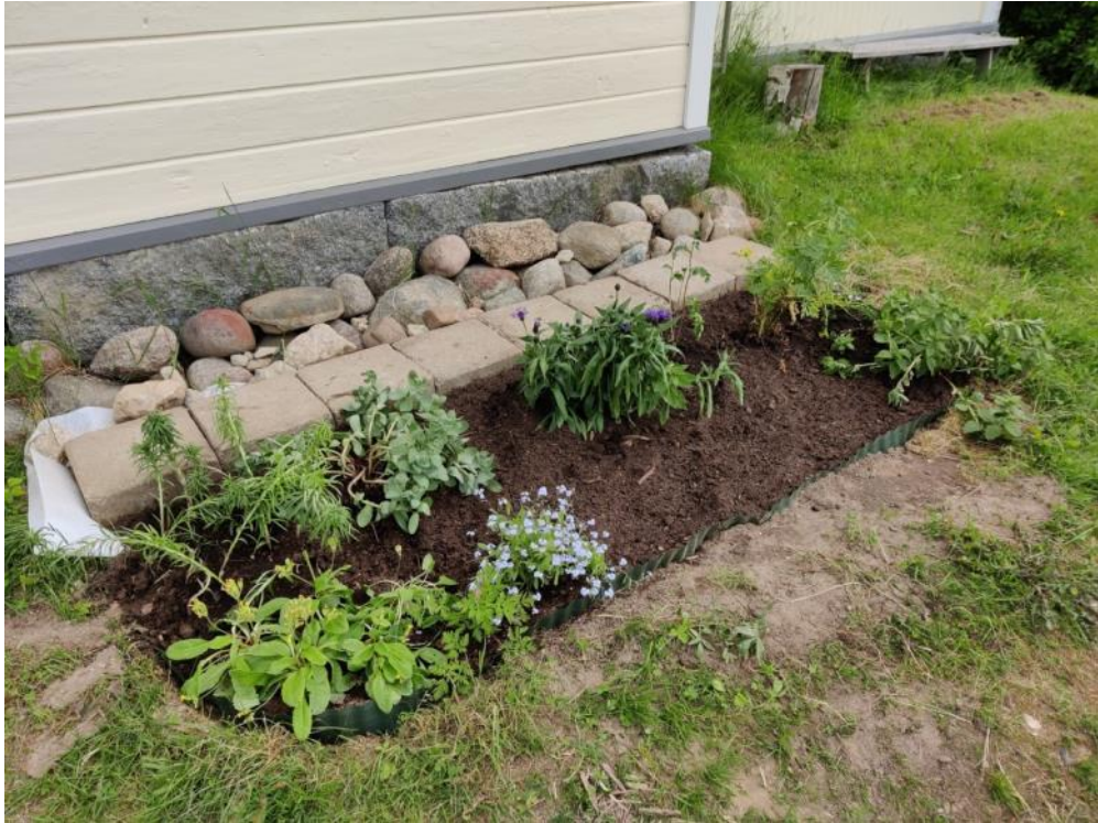
Kuva 55 Yläkoulun päädyn perennapenkki on uudistunut