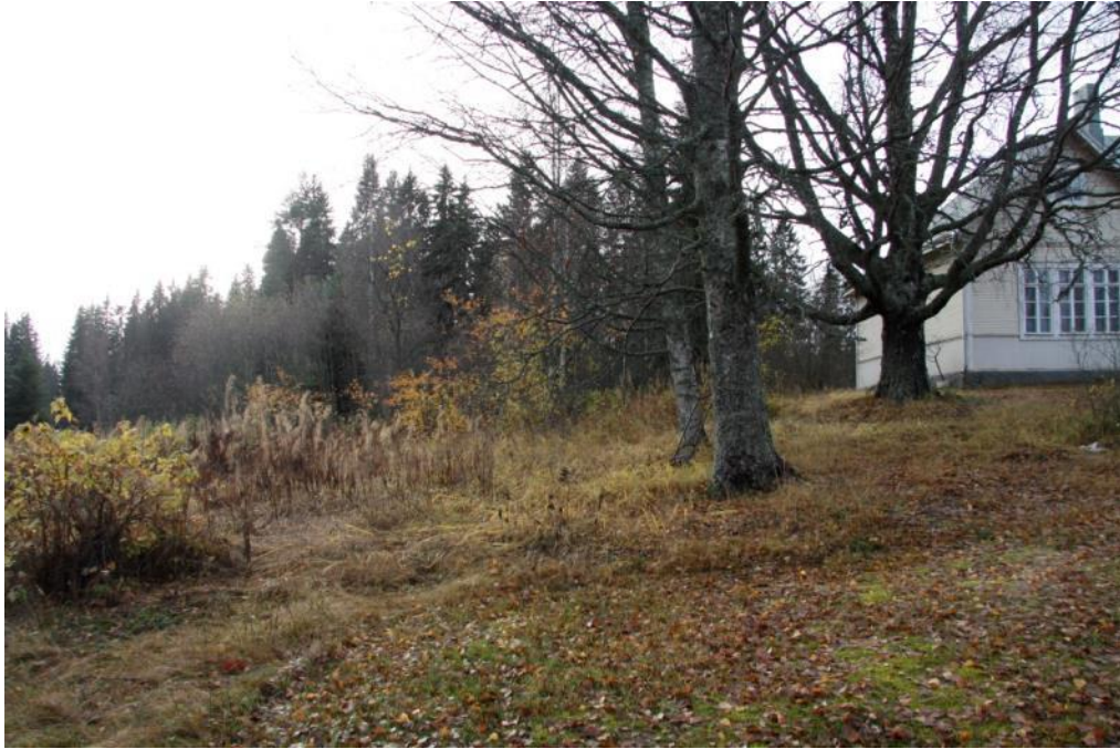
Kuva 51 Hyötypuutarha oli pahasti puskitunut