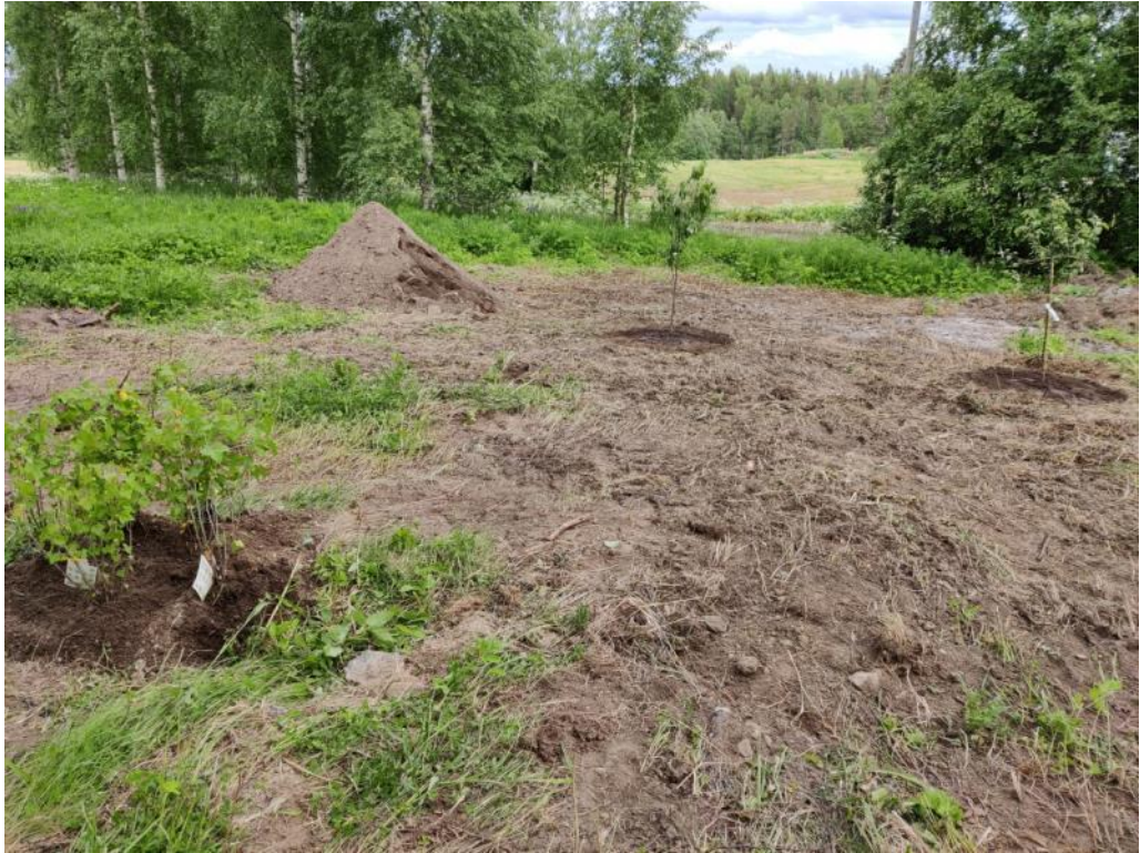
Kuva 61 Hyötytarhaan istutettiin raivauksen jälkeen uusia omenapuita ja marjapensaita