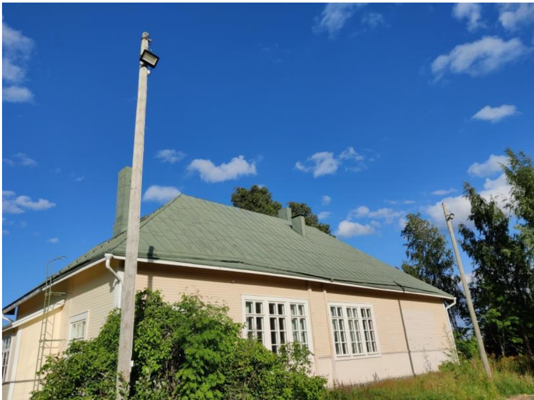
Kuva 39 Pelikenttä sai nykyaikaiset uudet valaisimet ja turhat vanhat valopylväät poistettiin