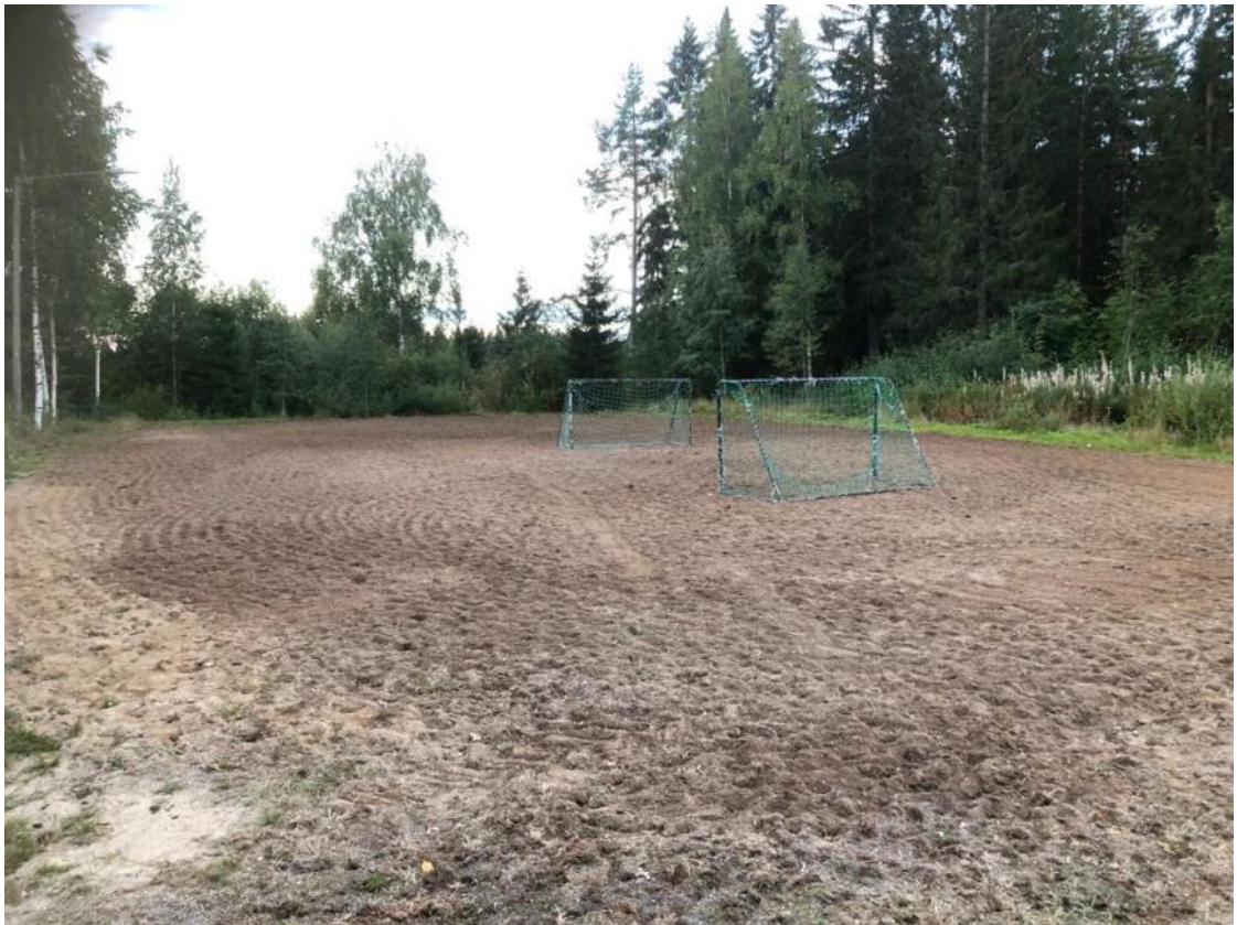
Kuva 74 Kasvillisuus on poistettu pelikentän pinnasta