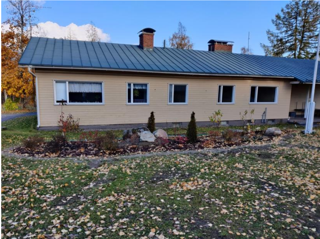
Kuva 59 Alakoulun edusta on saanut uusitut istutukset