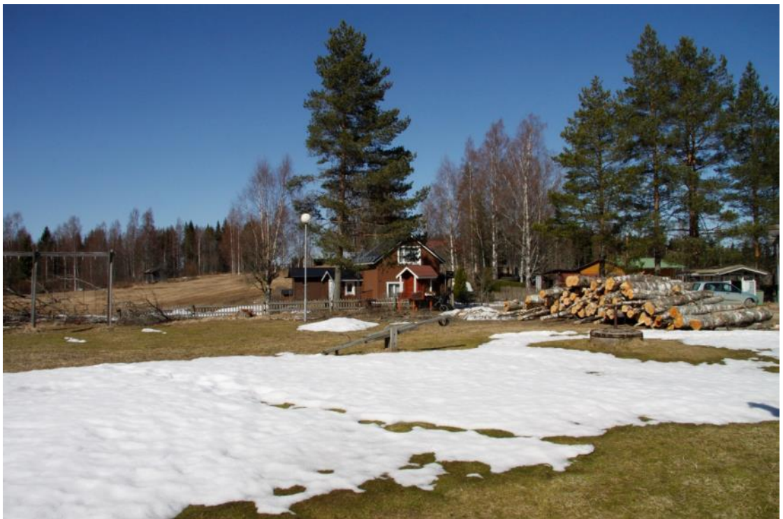
Kuva 2 Leikkikentän ympäristöstä kaadettuja ja pinoon ajettuja puita