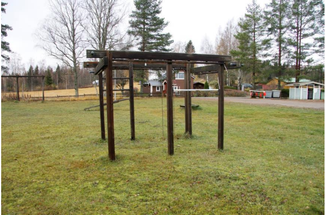
Kuva 6 Vanha rikkinäinen kiipeilyteline