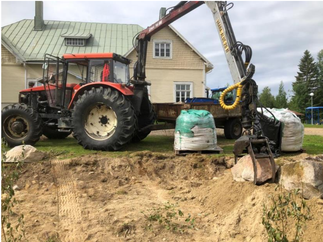
Kuva 57 Istutusalueen täyttäminen aloitettiin asettamalla kivet paikoilleen