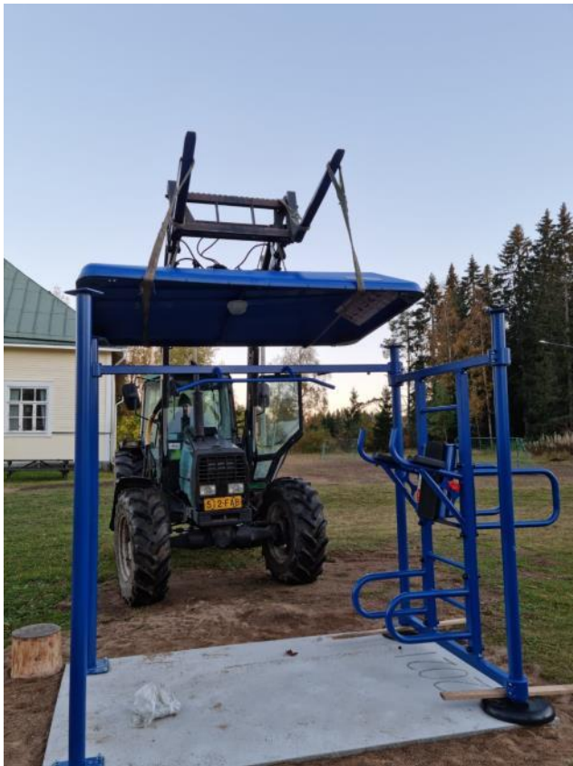
Kuva 19 Kuntoilukeskuksen katon asennus