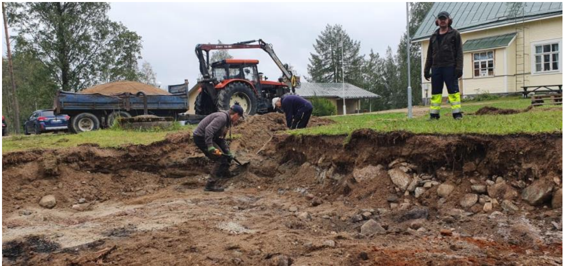
Kuva 13 Uusille leikkivälineille kaivettiin riittävät pohjat