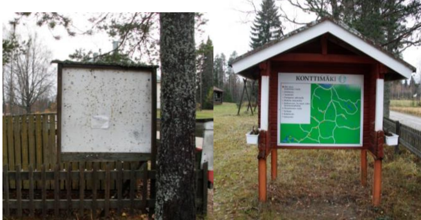
Kuva 43 Vanha ilmoitustaulu oli huonokuntoinen ja info-aulun kartta vanhentunut

ulkovalopylvääseen. Näin pyrittiin varmistamaan, että leikkipuistossa leikkivät lapset eivät altistu passiiviselle tupakoinnille.