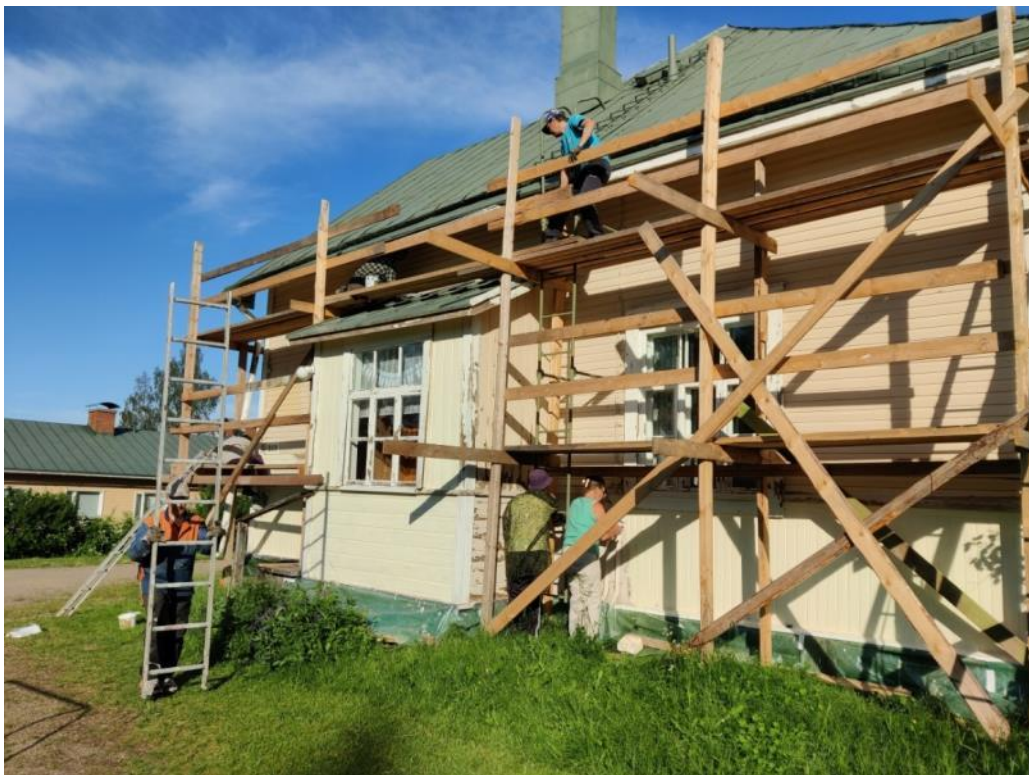
Kuva 27 Ensimmäisen maalikerroksen maalausta