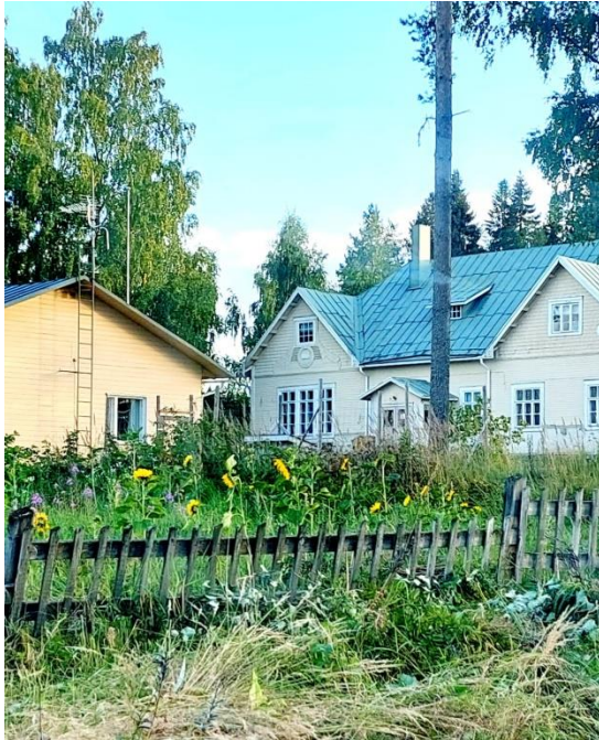
Kuva 71 Pellon kukat tervehtivät ohikulkijaa