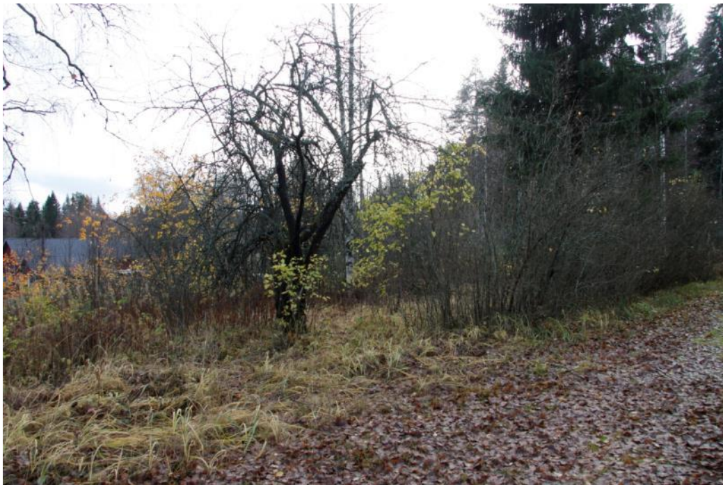
Kuva 52 Vanhat kirsikka- ja omenapuut olivat jääneet muun puuston varjoon