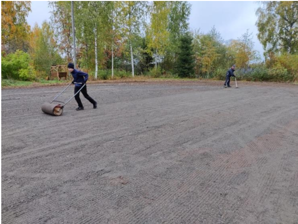
Kuva 75 Lopuksi uusi kivituhka tiivistettiin