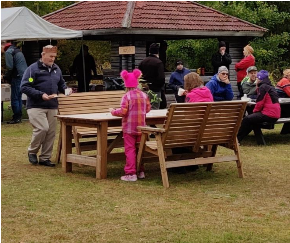
Kuva 65 Uudet penkit pääsivät pihan avajaisissa heti käyttöön