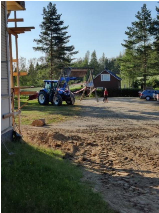
Kuva 9 Toinen keinunrunko siirrettiin parkkialueelta leikkikentälle