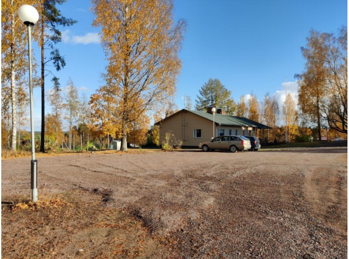
Kuva 47 Parkkialue on laajentunut ja saanut kunnollisen murskepinnan sekä valaistusta ja lämpötolpan