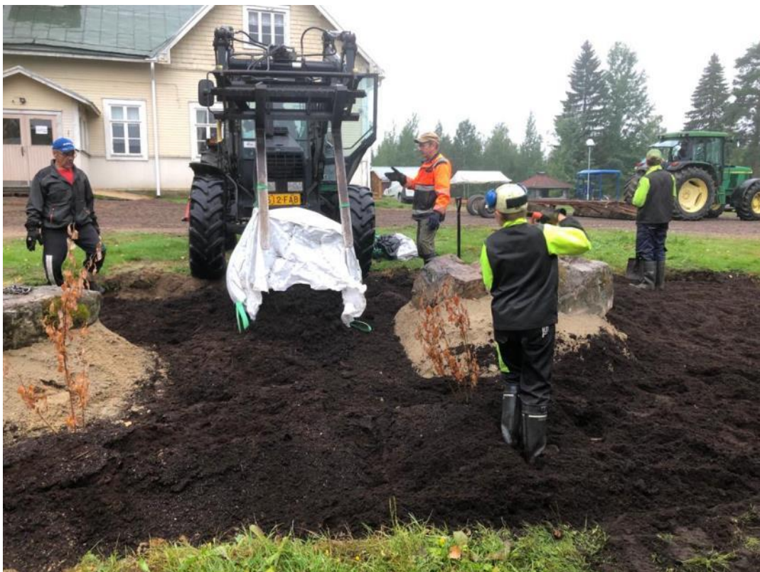
Kuva 58 Koko istutusalueen kasvialusta uusittiin laadukkaalla mullalla