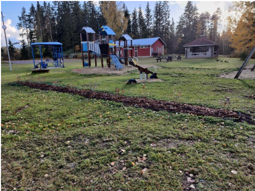
Kuva 54 Pensasaita rajaa nyt kulkua suoraan leikkikentältä parkkialueelle