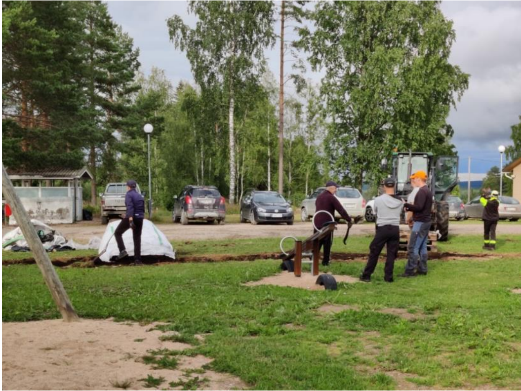
Kuva 53 Pensasaitaa varten parkkipaikan ja leikkikentän väliin vaihdettiin istutusmulta