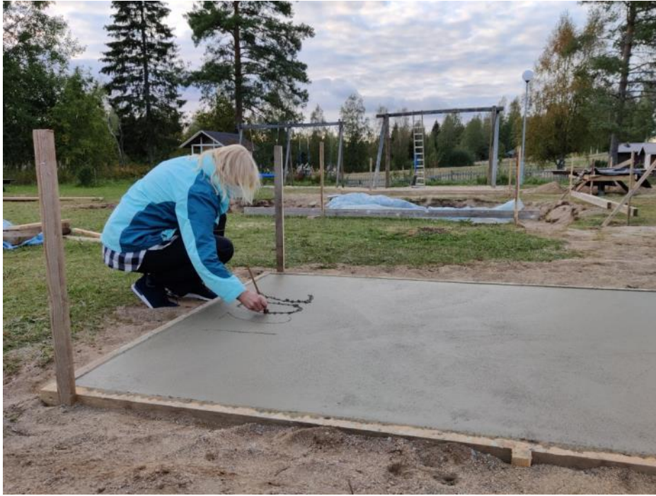
Kuva 18 Kuntoilukeskuksen lattiaan valettiin vuosiluku muistiin