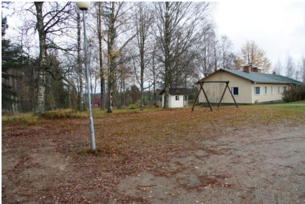
Kuva 46 Parkkialueen kapasiteetti ei riittänyt tapahtumiin ja leikkivälineitä oli sijoitettu vaarallisesti parkkialueen yhteyteen

Parkkialuetta laajennettiin alapellon suuntaan, kun isot koivut kaadettiin, keinu ja leikkimökki siirrettiin leikkialueelle. Parkkialueelle ja kulkuväylille ajettiin uutta soraa pintaan. Parkkialueelle pystytettiin lisäksi lämmitystolppa talon käyttäjien ja matkailijoiden käyttöön sekä sähkölähteeksi tapahtumiin mm. kovaäänisiä varten.