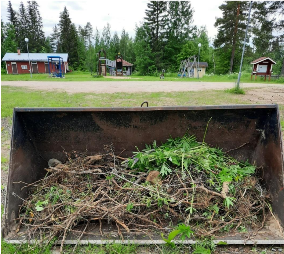
Kuva 69 Juuria ja lupiineja kerättiin vielä traktorin käynnin jälkeenkin