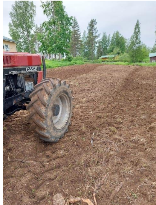
Kuva 68 Peltotöitä