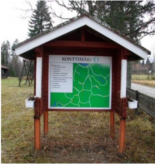
Kuva 36 Infotaululla ei ollut valaistusta lainkaan