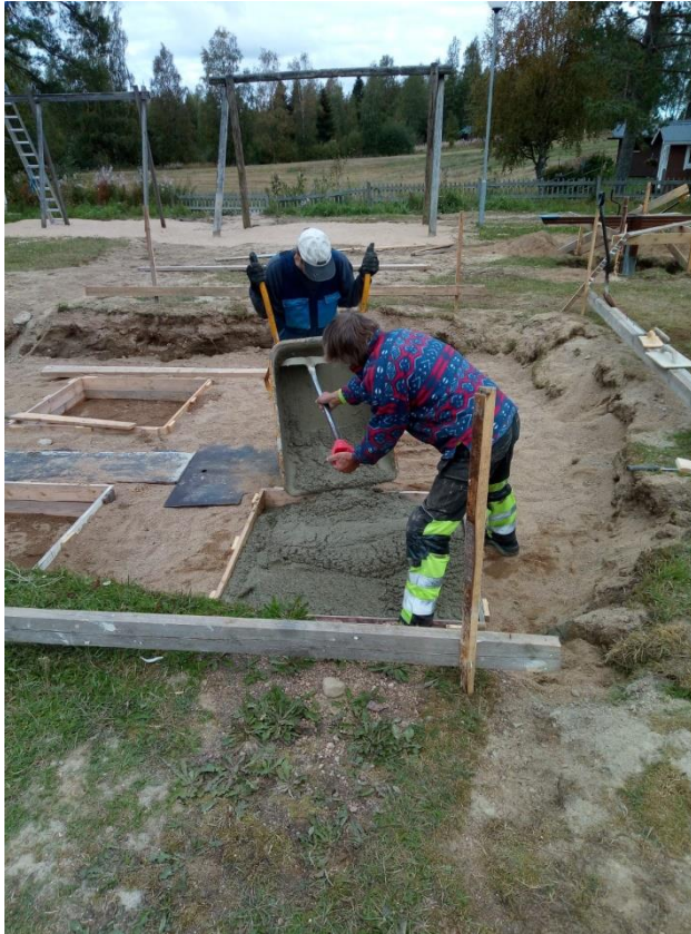
Kuva 14 Monitoimiväliseen perustusten valua