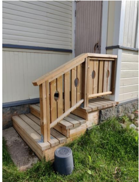
Kuva 32 Sivusisäänkäynnin uudet portaat ja kaide