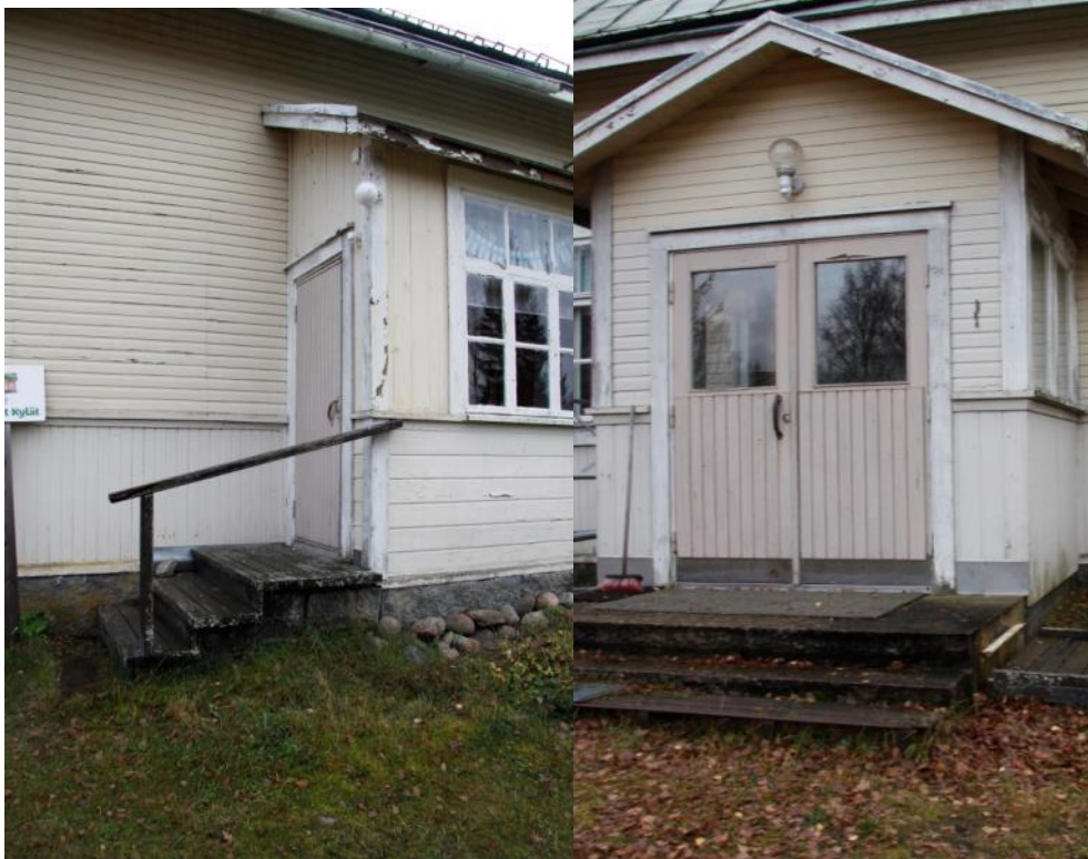
Kuva 35 Sisäänkäyntien yhteydessä oli pienet valaisimet, jotka eivät riittäneet valaisemaan kulkua rakennukseen