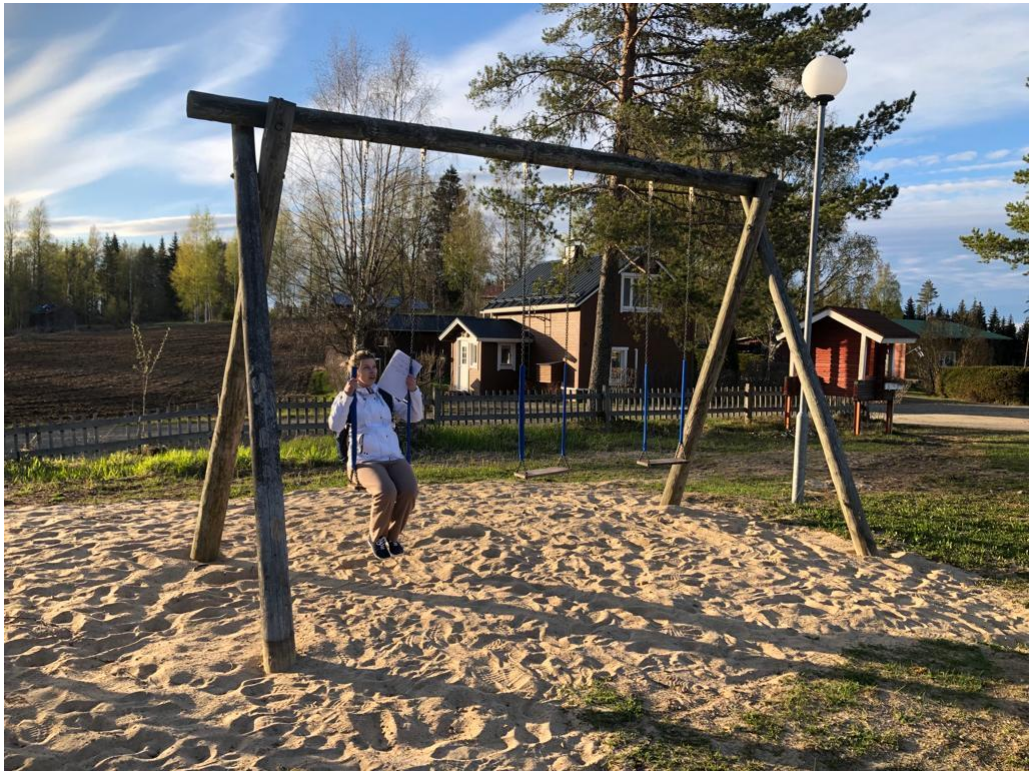
Kuva 12 Vanhatkin keinut ovat saaneet uudet suoja-putket ja sakkelit ketjuihin