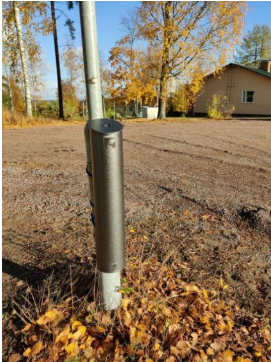
Kuva 44 Tuhka-astia asennettiin tupakkalain muutoksen takia kauemmas leikkikentästä