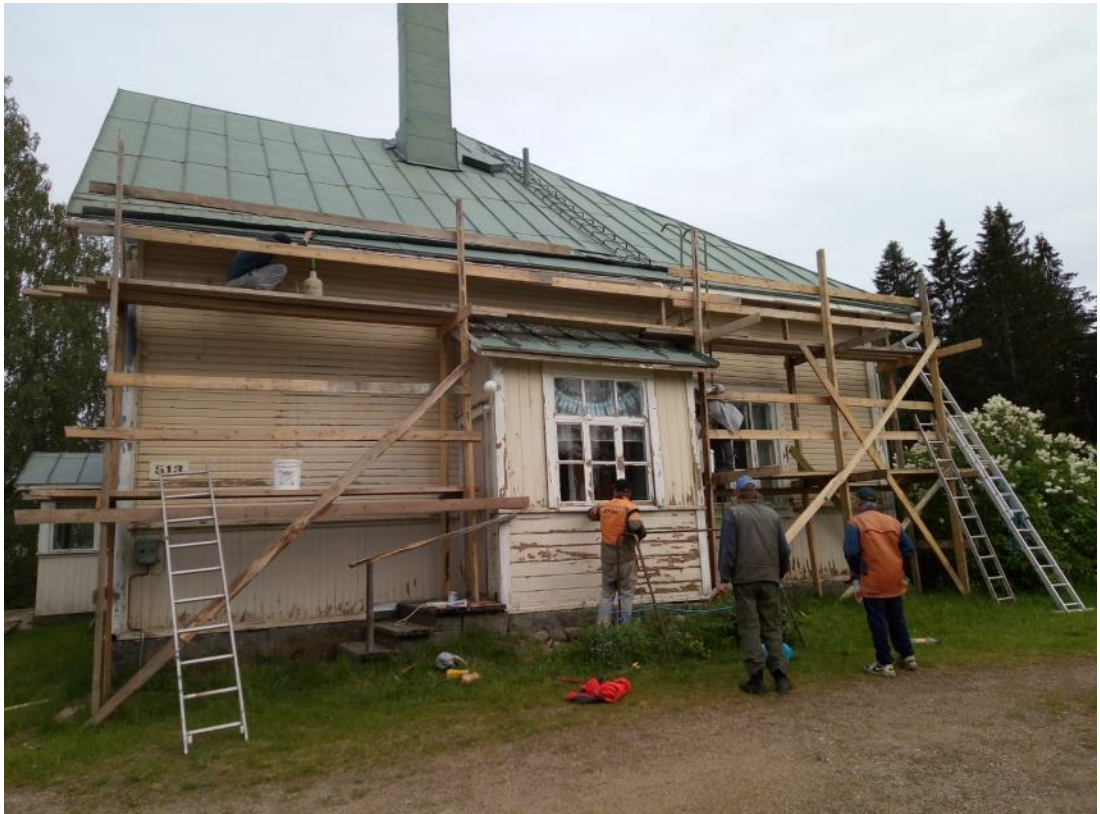
Kuva 26 Irtonaisen maalin raaputuksen jälkeen seinäpinnat pestiin maalipesuaineella