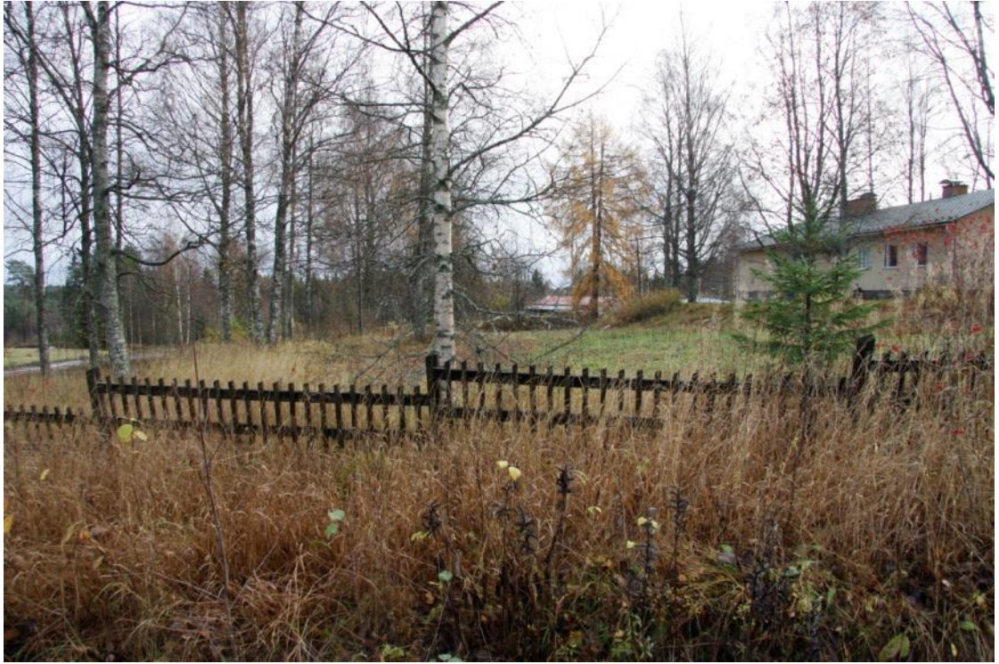
Kuva 66 Alapello oli ollut käyttämättömä pitkään ja lähinnä lupiinien valtaamana