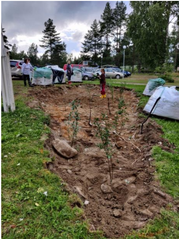
Kuva 56 Pensaiden kaivuun jäljiltä jäi iso hiekkainen kuoppa, johon suunniteltiin tarkasti uusien kasvien paikat