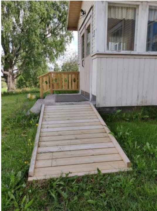
Kuva 31 Pääsisäänkäynnin uusi invaluiska ja kaide