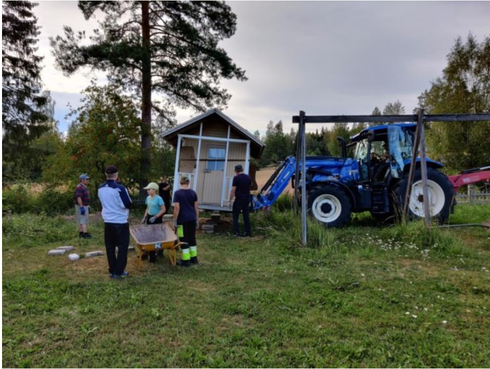
Kuva 8 Leikkimökki siirrettiin parkkialueen takaa leikkikentälle