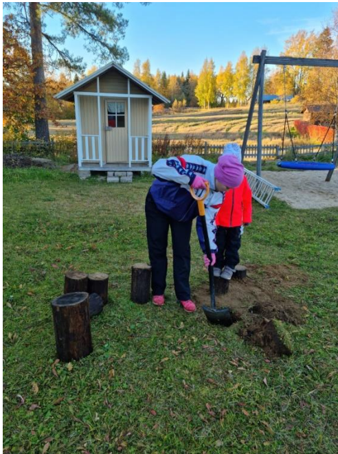
Kuva 21 Tasapainoradan asennusta