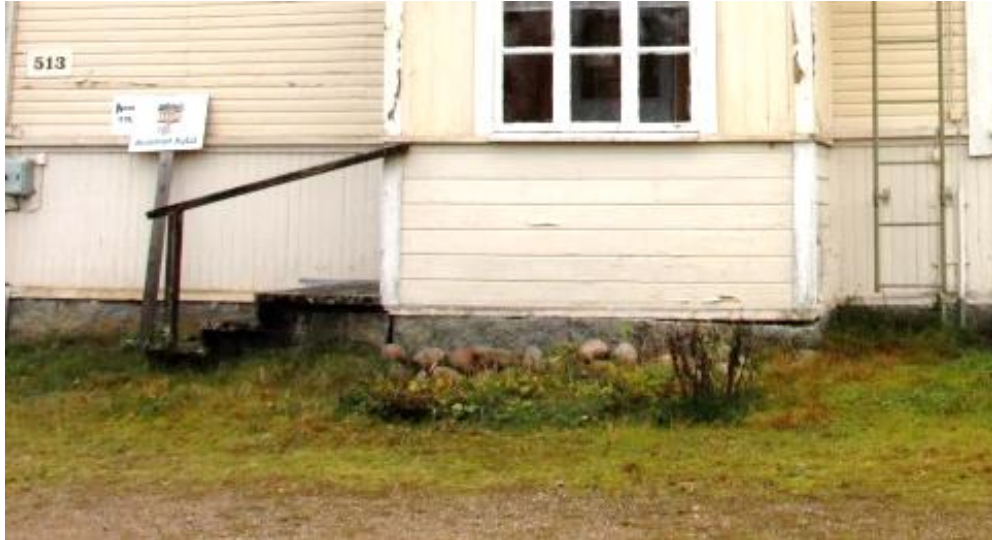
Kuva 49 Perennapenkki oli jo huonokuntoinen ja rikkaruohojen valtaama

hakkeella katettu polku. Lisäksi pihalle hankittiin kaksi siirrettävää puutarhapenkkiä.