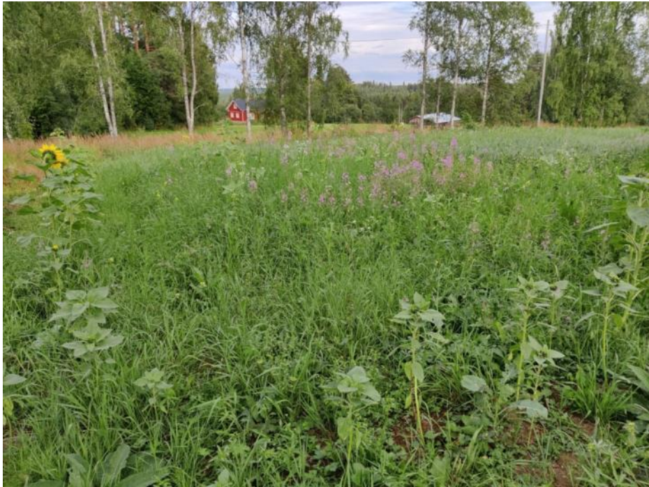
Kuva 70 Alapellolla kasvaa niittykukkia ja takaosassa peltoa kauraa