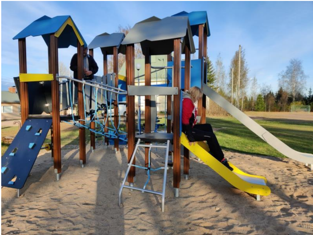
Kuva 23 Leikkipuiston käyttöönottotarkastus pidettiin 18.5.2022