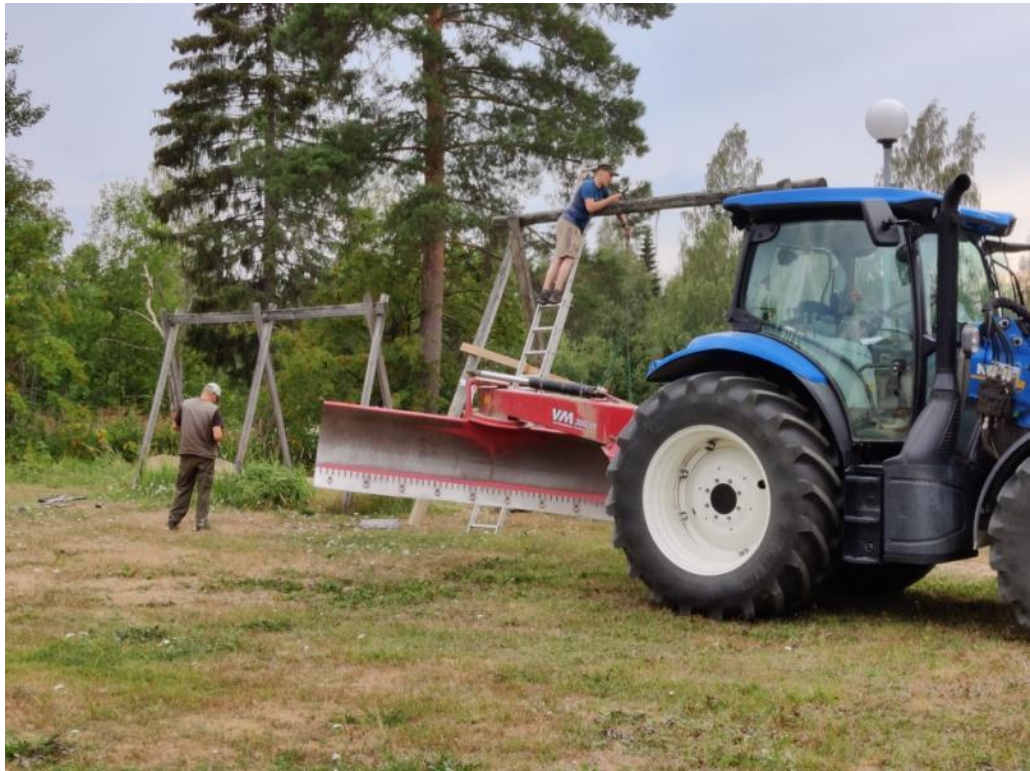
Kuva 10 Vanhat keinut irrotettiin ja kunnostettiin mm. uusilla suoja-putkilla