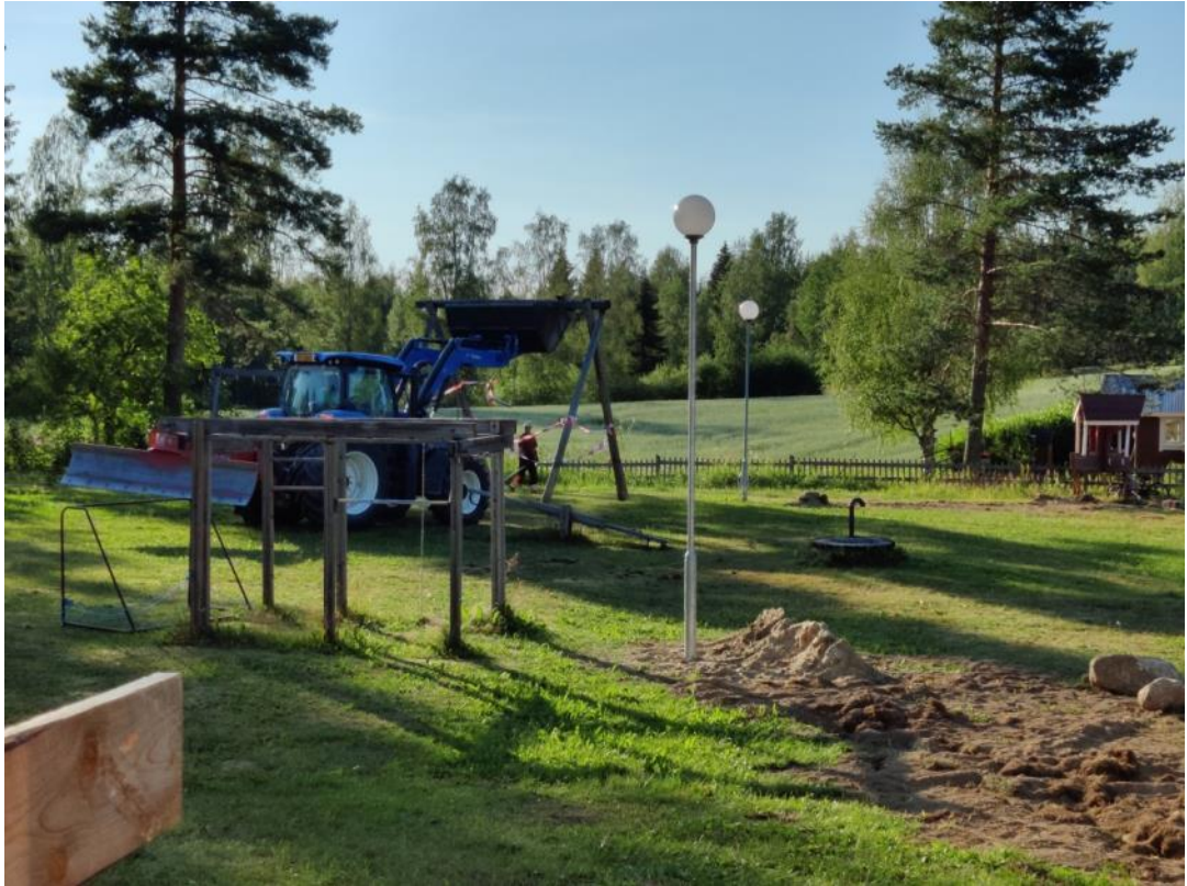
Kuva 38 Leikkialueen vaha pylväs sai uuden valaisimen ja alueelle lisättiin toinen pylväsvalaisin