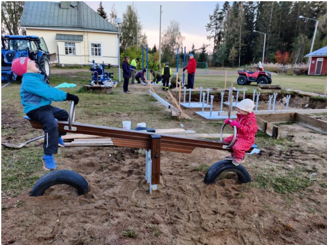
Kuva 17 Vaakakeinu valmiina, taustalla monitoimiväliseen perustukset ja kuntoilukeskuksen asennusta