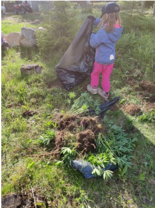
Kuva 67 Lupiineja kitettiin hartiavoimin