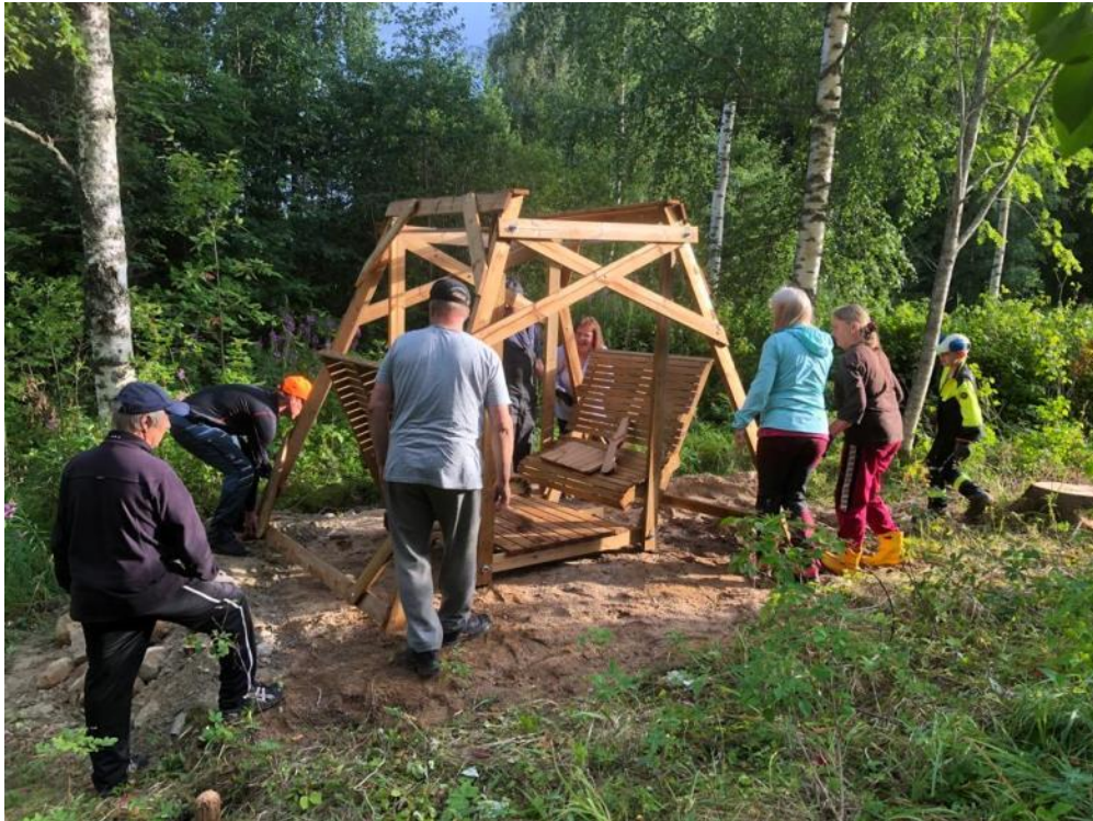
Kuva 62 Puutarhakeinua varten tehtiin kunnolliset pohjat, jotta keinu saatiin suoraan