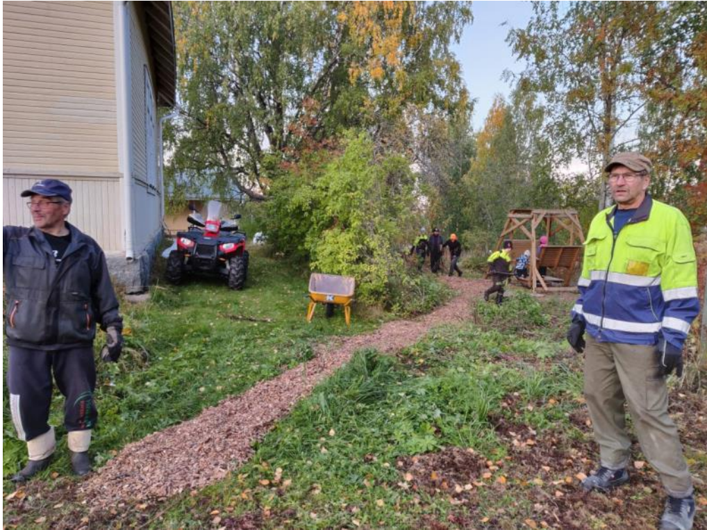
Kuva 63 Hyötytarhaankin pääsee nyt päivänvalo ja katettu polku johdattaa keinumaan