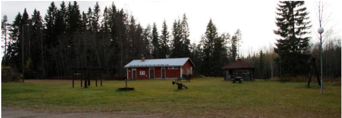
Kuva 33 Ennen hanketta leikkialuetta valaisi vain yksi oikealla näkyvä kulunut pylväsvalaisin. Vasemalla pelikentän valoista oli purettu sähköt pois.