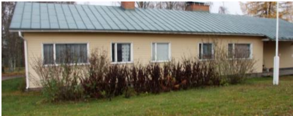
Kuva 50 Alakoulun edustan pensaat olivat huonokuntoiset