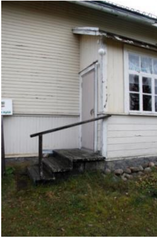
Kuva 30 Sivusisäänkäynnin rappuset olivat ennen hanketta kuluneet ja kaide hutera