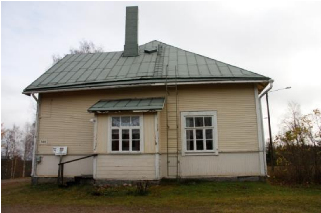
Kuva 25 Ennen hanketta koulun maalipinta oli jo rapistuneen näköinen

Maalaustyön avuksi rakennettiin telineet varastossa valmiina olleesta puutavarasta. Työ aloitettiin raaputtamalla vanha irtonainen maali pois ja pesemällä seinä. Yksittäisiä lahonneita lautoja jouduttiin uusimaan. Uudella maalilla maalattiin kaikkiaan neljä maalikerrosta ennen kuin seinän sävy saatiin tasaiseksi.