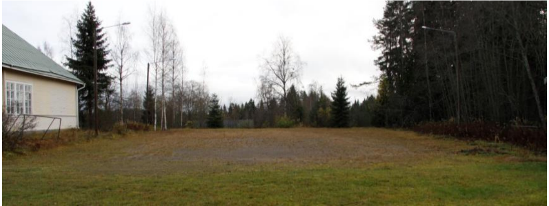
Kuva 73 Pelikenttä oli päässyt kasvamaan reunoiltaan umpeen ja ympärillä oli vanhat toimimattomat valopylväät