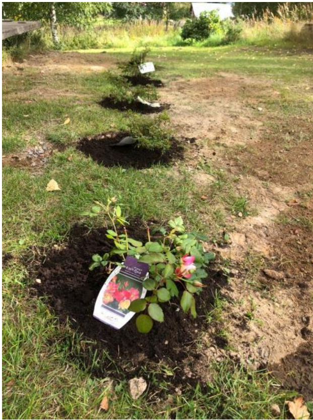
Kuva 60 Alakoulun terassin eteen istutettiin ruusupensaita