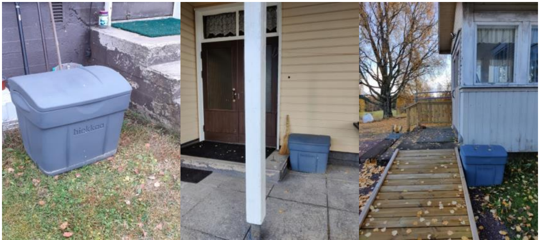
Kuva 48 Uudet hiekka-astiat sisäänkäyntien yhteydessä helpottavat talvikunnossapitoa