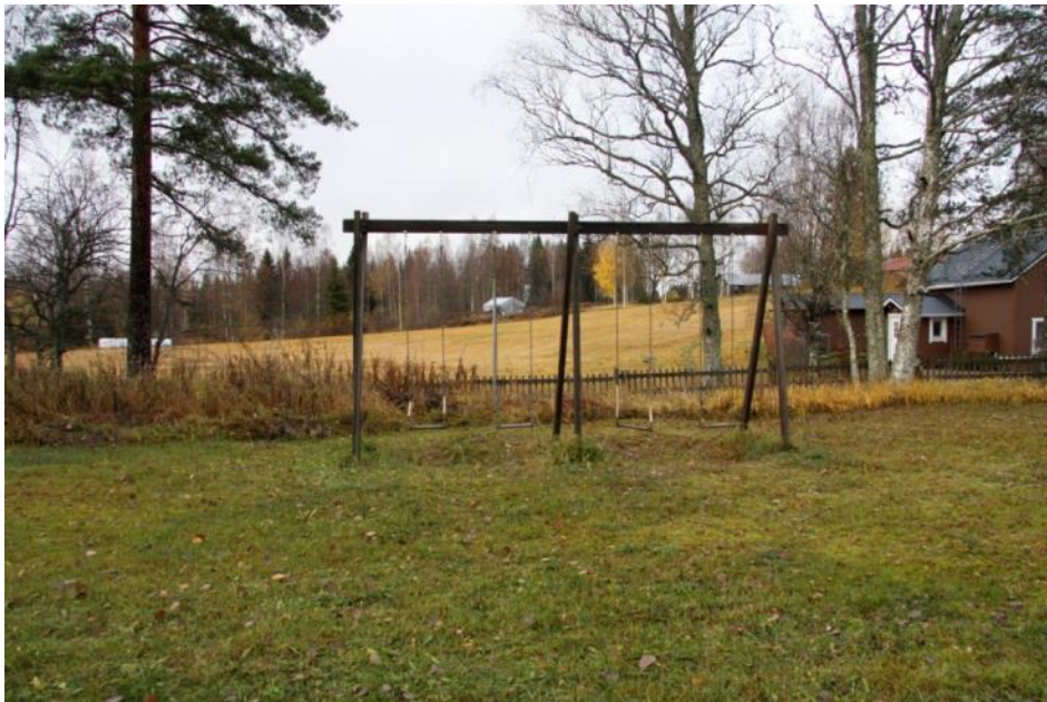
Kuva 5 Huonokuntoiset vanhat keinut