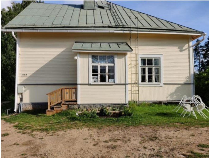
Kuva 28 Maalattu päätyulkisivu, jossa näkyy myös uusittu sähkökaappi ja rappuset