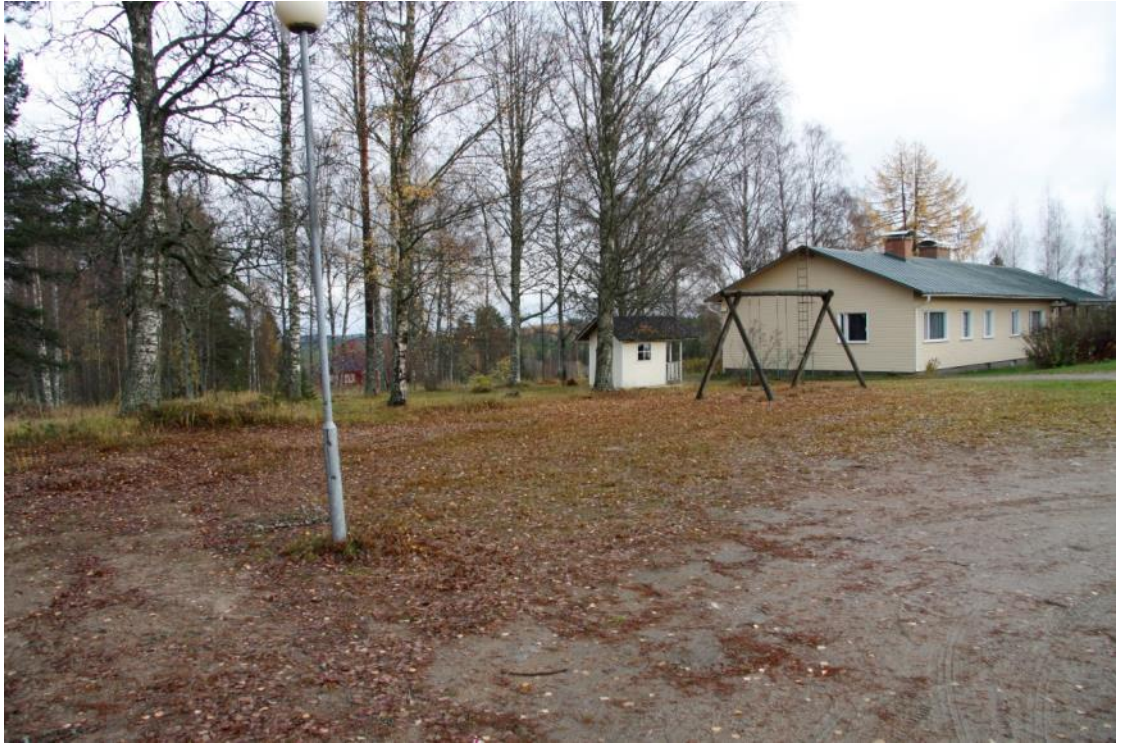
Kuva 34 Parkkialuetta valaisi aikaisemmin vain yksi kulunut pylväsvälaisin