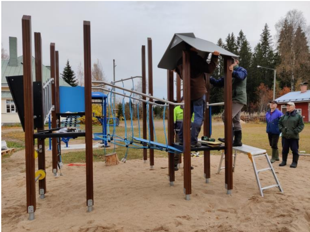
Kuva 15 Monitoimikeskuksen asennusta