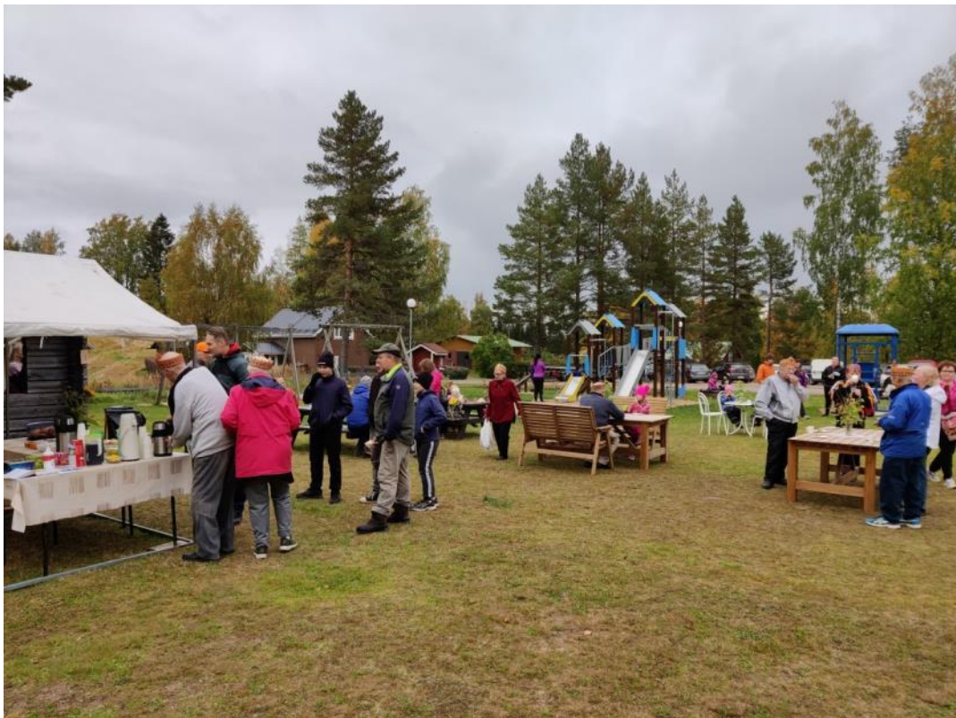
Kuva 79 Avajaisiin saapui mukavasti ihmisiä juhlistamaan hankkeen valmistumista