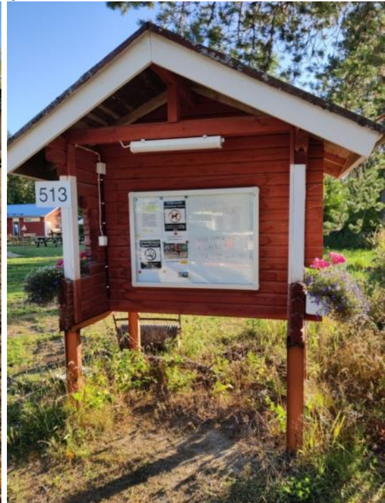
Kuva 45 Nyt infotaululla on suojalasin takana oleva ilmoitustaulu, valaistus ja talonnumero