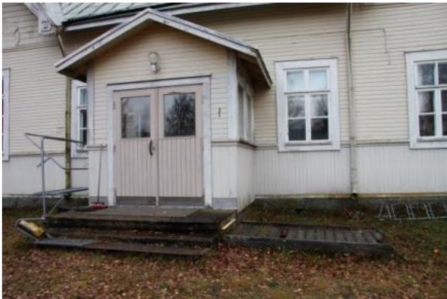
Kuva 29 Pääsisäänkäynnin invaluiska oli ennen hanketta pahasti lahonnut

Pääsisäänkäynnin portaisiin tehtiin kaide ja lahonnut invaluiska uusittiin. Sivusisäänkäynnin rappuset uusittiin ja niihin tehtiin uusi kaide. Kaiteiden suunnittelussa haettiin vanhan rakennuksen tyyliin sopivaa mallia.