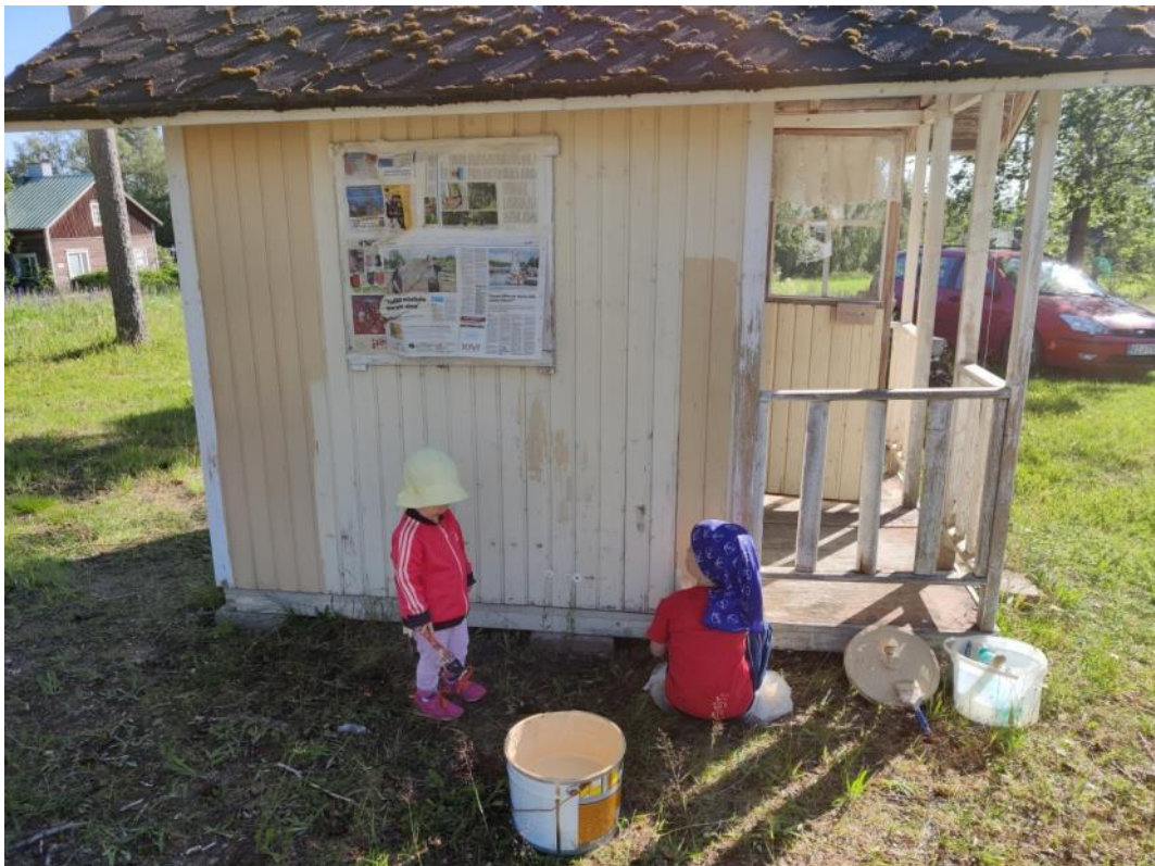
Kuva 7 Lapset osallistuivat leikkimökin maalaukseen