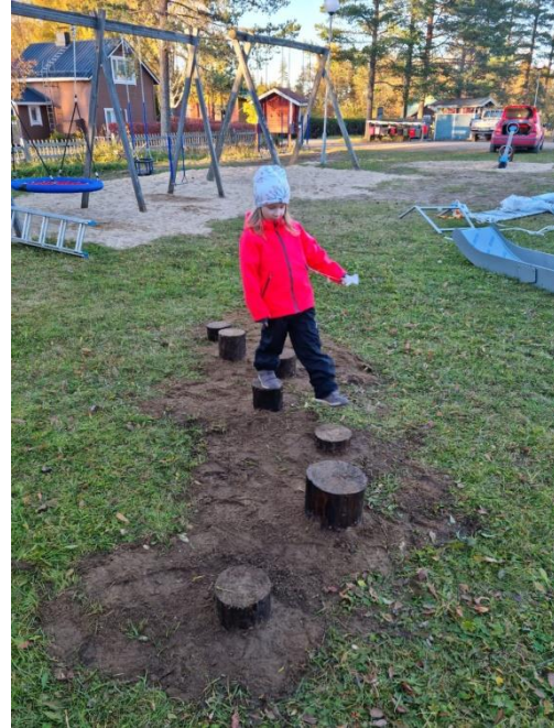
Kuva 22 Tasapainorata valmiina