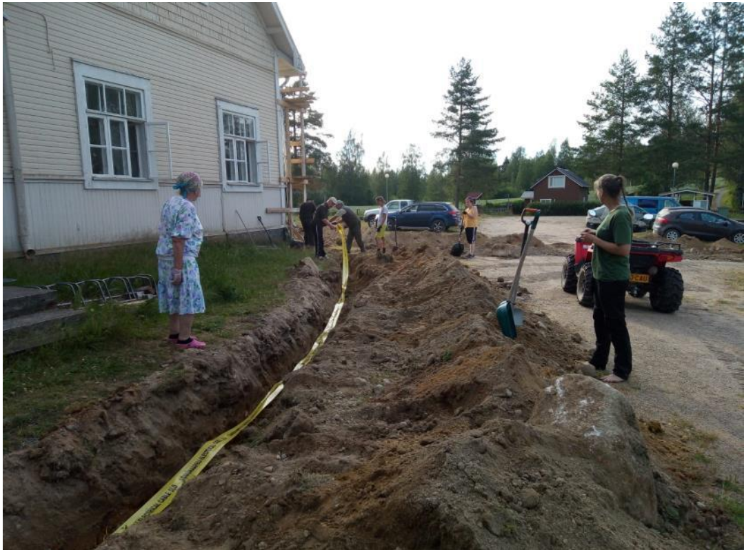
Kuva 37 Maakaapelit vedettiin ammattilaisen ohjeiden mukaisesti talkootyönä