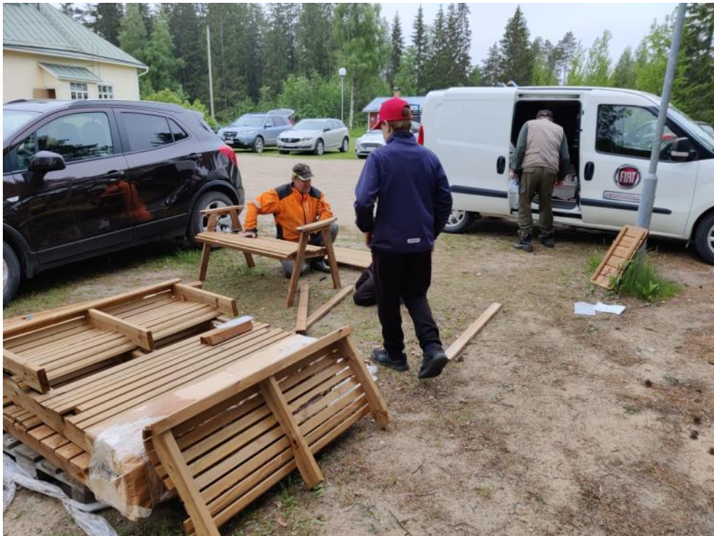
Kuva 64 Pihalle hankittiin myös kaksi uutta siirrettävää puutarhapenkkiä