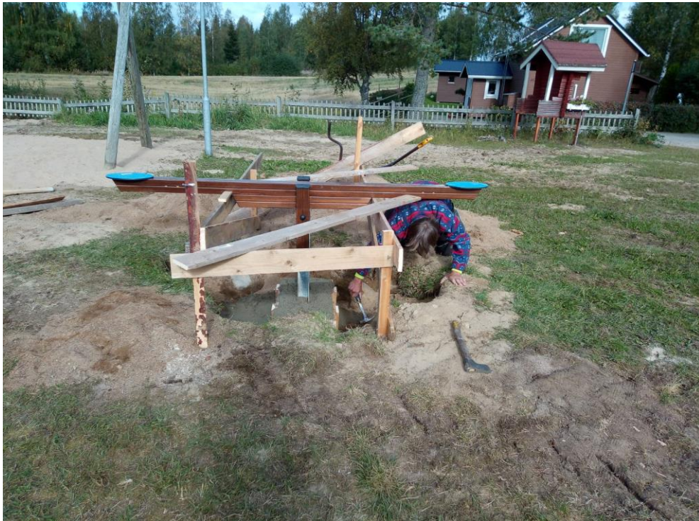
Kuva 16 Vaakakeinin valu