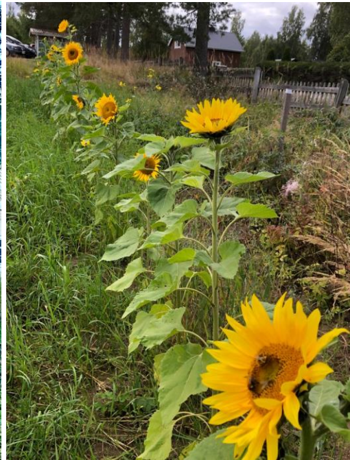
Kuva 72 Pölyttäjätkin ovat löytäneet pellon kukat