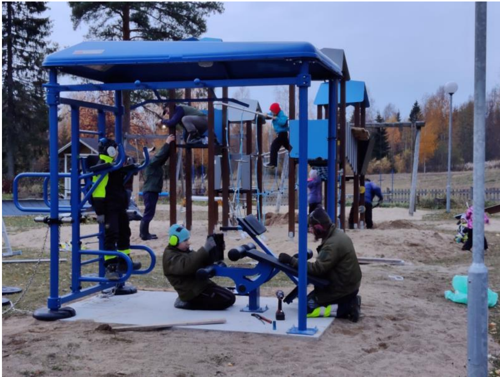
Kuva 20 Välineasennuksia kuntoilukeskukseen