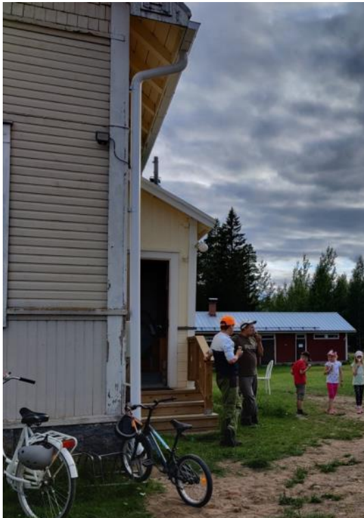
Kuva 41 Yläkoulun nurkkaan lisättiin valot liiketunnistimella