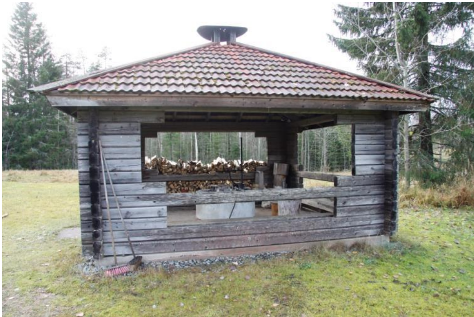
Kuva 76 Grillikatoksen avoimet seinät aiheuttivat vaivaa tuulisella säällä

Grillikatokseen kaivattiin tuulisuojaa, joten kahdelle seinustalle asennettiin irrotettavat levyt tuulensuojaksi.