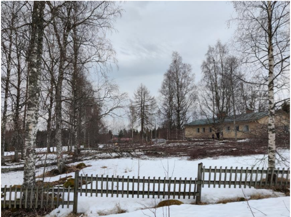
Kuva 1 Alapellon ympäristöstä kaadettuja puita