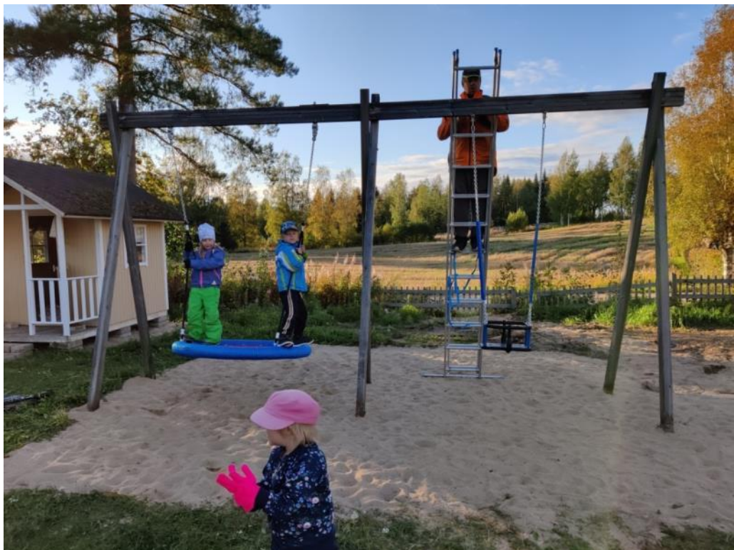
Kuva 11 Pesäkeinu ja vauvakeinu asennettuina