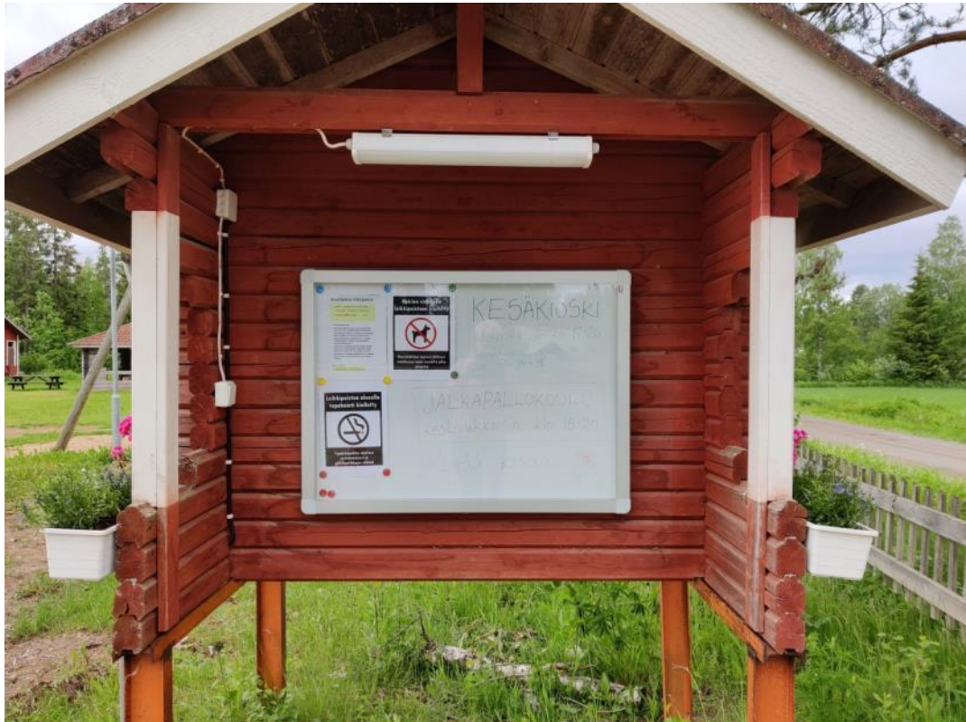
Kuva 42 Ilmoitustaulu sai valot omalla kytkimellä