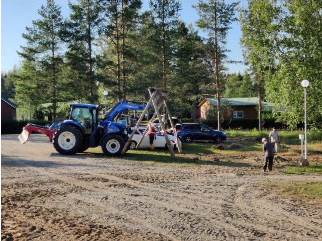
Kuva 40 Parkkialueen pylvään valaisin uusittiin ja lisättiin toinen pylväsvalaisin sekä lämmitystolppa